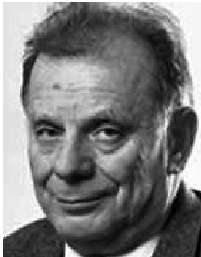
Академик РАН, Нобелевский лауреат