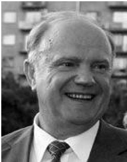
Председатель ЦК КПРФ