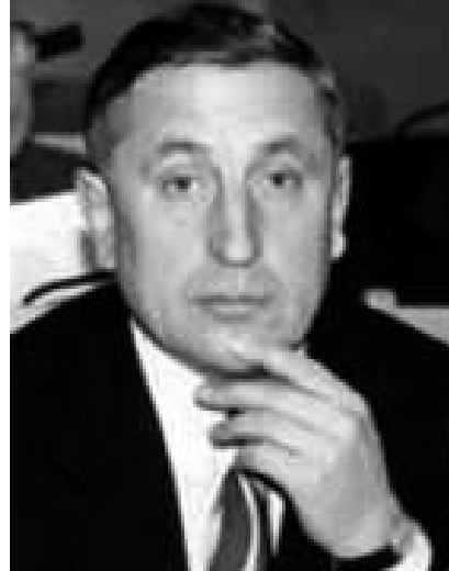
Депутат Госдумы, член Агропромышленного Союза России